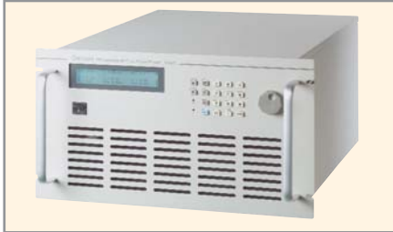
Рис. 2. Модель 61505