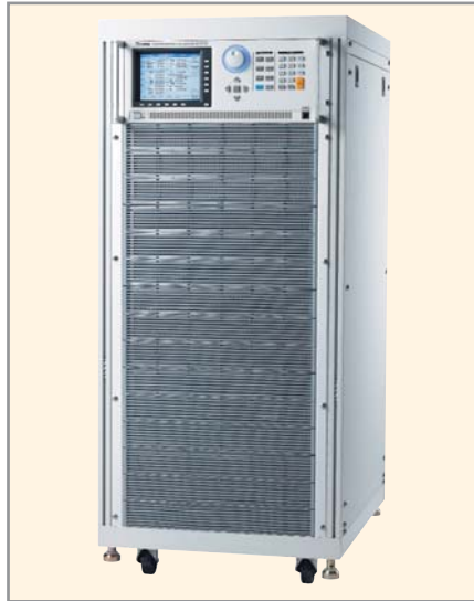
Рис. 3. Модель 61512