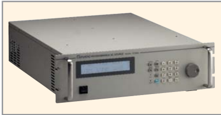
Рис. 1. Модель 61504