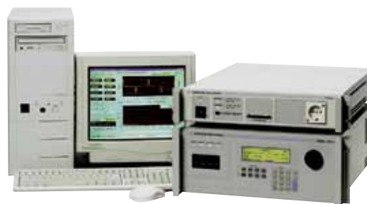
Рис.1. Система для испытаний на соответствие стандартам МЭК

Спецификации МЭК постоянно обновляются и совершенствуются. В 2011 году ожидается ряд изменений в спецификациях МЭК, в том числе в стандартах 61000-3-2 и 61000-3-3. Так, в стандарт 61000-3-3 будут внесены дополнения, отражающие переход высокоэффективных маломощных световых приборов на компактные флюоресцентные и светодиодные лампы. Дело в том, что эти лампы реагируют на колебания напряжения иначе, чем обычные лампы накаливания, на которых основан стандарт фликера. Для завершения данной работы, вероятно, потребуется несколько лет. Что касается стандарта 61000-3-2, то новая редакция будет принята в течение следующих шести месяцев. В стандарте появится обновленная таблица испытаний электроприводов с регулируемой скоростью. В ней учитываются